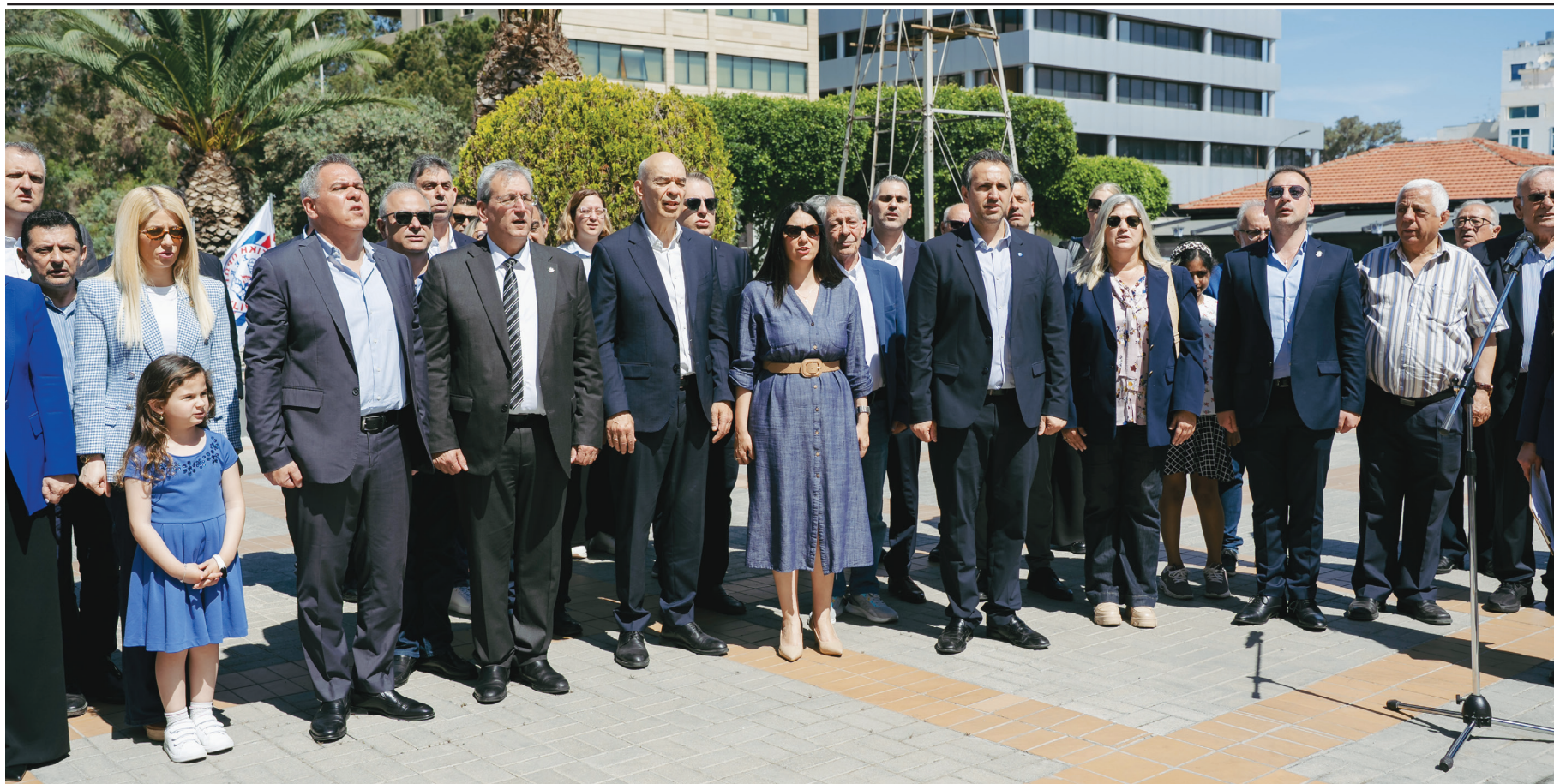
Ο Εθνικός Ύμνος αμέσως μετά την κατάθεση στεφάνων