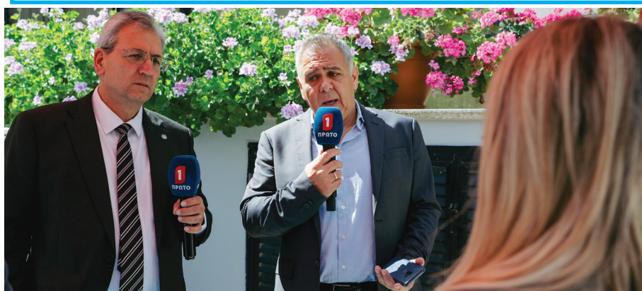
Ο Γενικός Γραμματέας της ΣΕΚ και ο Υπουργός Εργασίας μιλούν σε ζωντανή μετάδοση στο Ράδιο Πρώτο για τα φλέγοντα εργασιακά ζητήματα