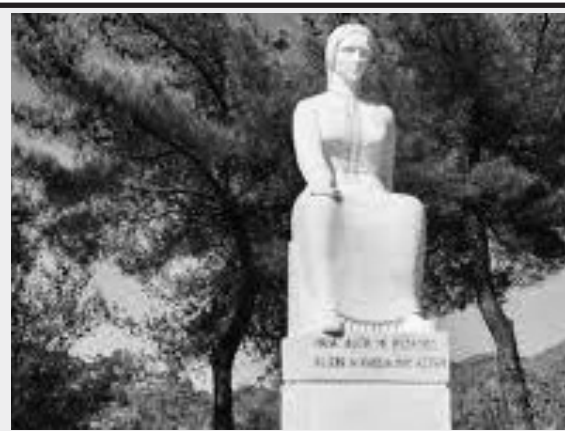
Κυριακή 10 Μαΐου 2025

Παράλληλα, επισημαίνεται πως η Κυβέρνηση οφείλει να κινηθεί χωρίς καθυστέρηση και να αποταθεί άμεσα στο Ευρωπαϊκό Ταμείο Στήριξης, με στόχο την εξασφάλιση χρηματοδοτικής στήριξης για την ενίσχυση του τουριστικού τομέα και τη διασφάλιση των θέσεων εργασίας αποτρέποντας ενδεχόμενες αρνητικές εξελίξεις.